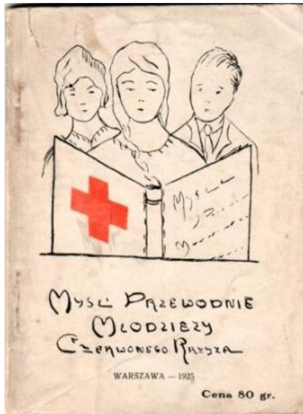
Fot. Myśli Przewodnie Młodzieży Czerwonego Krzyża, 1925 r, Fot. MOO PCK