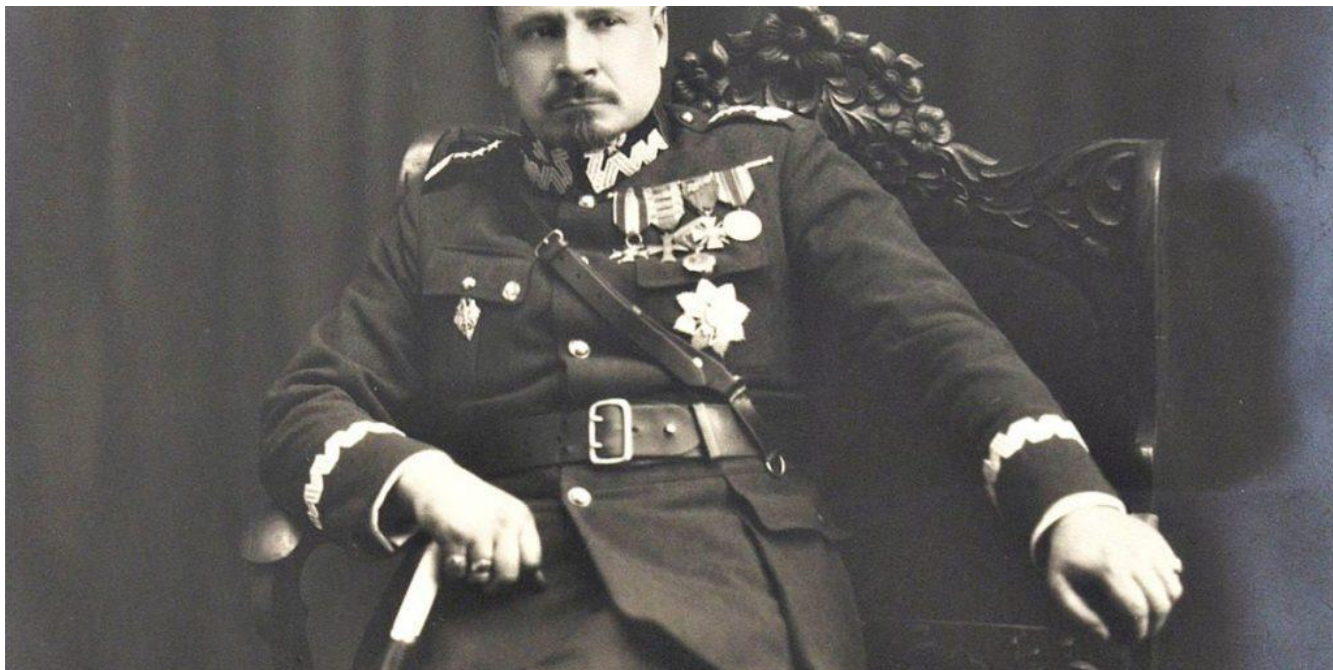
Fot. Gen. Józef Haller

„Niechaj Krzyż Czerwony nie czerwieni się jako rana niezabliźniona, ale niech krasi czerwień serca kochającego bliźniego i niosącego mu czynną pomoc” – wypowiedź gen. Józefa Hallera z 1919 r.