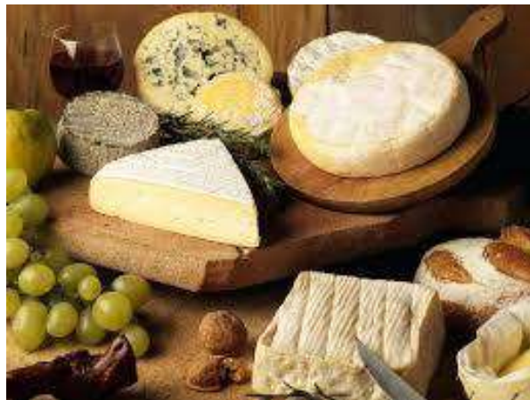
Aromatyczne sery pleśniowe.

zawdzięczają swoją nazwę delikatnym zielonkavo-niebieskim żyłkom pleśni, przerastającym białokremową masę. Z wyjątkiem słynnego francuskiego sera roquefort, wytwarzanego z mleka owczego, sery te produkowane są z mleka krowiego. Mają charakterystyczny grzybowy, pikantny smak i bardzo szerokie zastosowanie. Można je bowiem dodawać do sałatek, farszów, sosów, zapiekanek, past serowych albo też po prostu jeść z pieczywem.