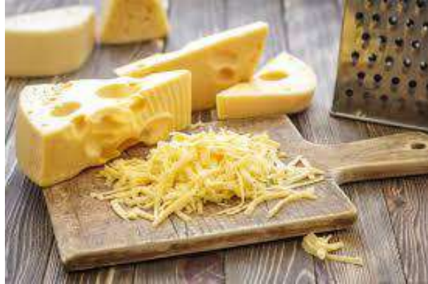
Najpopularniejsze sery twarde.