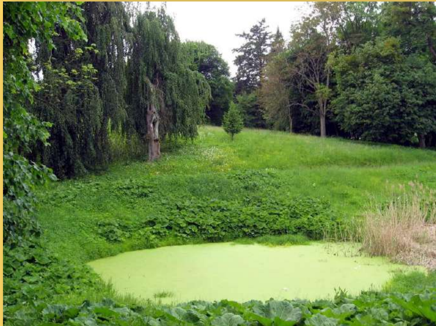
Uroki parku w Sartowicach

Oznacza to, że mogli czerpać zyski z tytułu dzierżawy, ale bez prawa do własności ziemi i bez możliwości nabycia jej przez zasiedzenie.