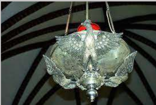
Wotywna lampa – kościół w Sarnowie