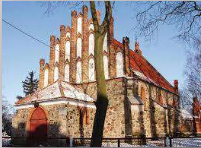
Kościół w Sarnowie

Wieś została założona przez Krzyżaków na początku XIII w. pod nazwą Szarno. Miejscowość należała do komturii starogrodzkiej. Po wojnie trzynastoletniej stała się królewszczyzną, a na początku XVI w. przeszła w ręce biskupów chełmińskich.