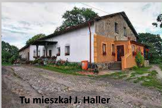
Tu mieszkał J. Haller

We wsi zachowały się pamiątki po mieszkającym tu gen. Hallerze. Oprócz dworu i resztek parku zachowała się także kapliczka św. Andrzeja Boboli ufundowana przez generała w 1936 r. stojąca na skrzyżowaniu szosy i polnej drogi do Sarnowa.