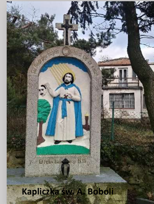
Kapliczka św. A. Boboli