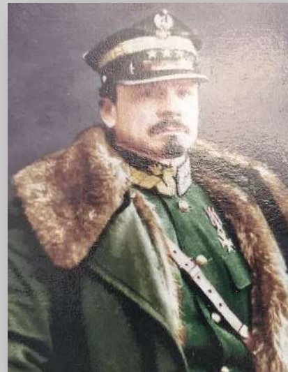
Gen. Józef Haller

- wieś w Polsce położona w województwie kujawsko-pomorskim, w powiecie chełmińskim, w gminie Stolno.