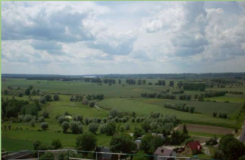
Widok z Góry Zamkowej

Nieistniejący już zamek krzyżacki znajdował się na tzw. Górze Zamkowej, będącej krawędzią Wysoczyzny Chełmińskiej stromo opadającej do doliny Wisły.