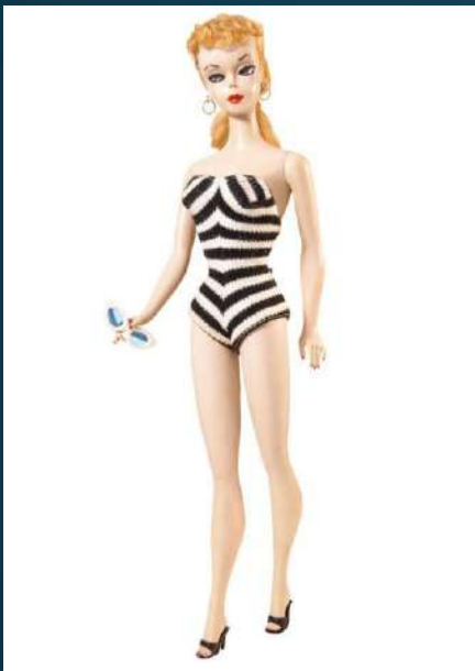
Pierwsza lalka Barbie