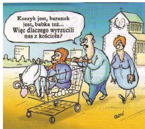
Rys. Piotr Rajczy

My grzesznicy radujmy się bo Pan zmartwychwstał! Świętujmy to przede wszystkim oczyszczając serca, wyzbywając się złych myśli, uczynków. Zróbmy coś dobrego np. ucieszmy kogoś pomagając mu, obdarzając ciepłem, dobrym słowem...nadzieją, mimo że czasy trudne. Nie dajmy sobie zabrać świąt. Niech radują się serca nasze, tak bez lęku, bez strachu bo „Tam gdzie zaczyna się strach, kończy się wolność” . Zadbajmy o siebie i innych ofiarując sobie nawzajem miłość, nawet odrobinę;-)...Zadbajmy o (potrzebujących) bliźnich, którzy tak naprawdę potrzebują naszej bliskości a cierpią, chorują najbardziej przez izolację, oddalenie – to najczęstsza przyczyna chorób. Czyńmy dobro w myśl słów Chrystusa: „Coście uczynili jednemu z tych najmniejszych, mnieście uczynili.” Nie dajmy się straszyć! Odwagi! Optymizmu! Wiary!