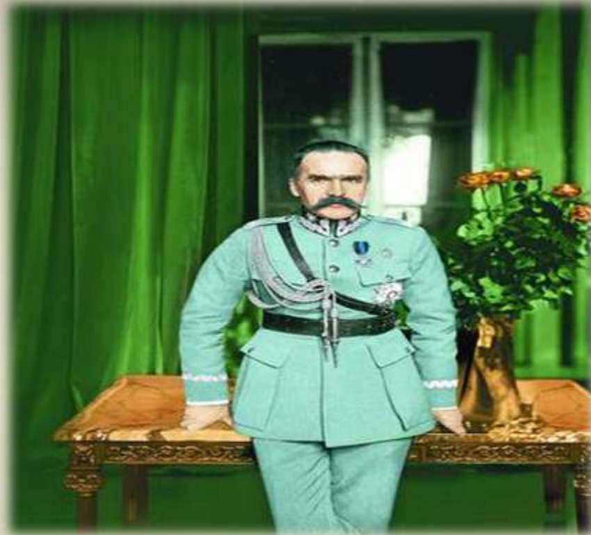
JÓZEF KLEMENS PIŁSUDSKI 1867- 1935