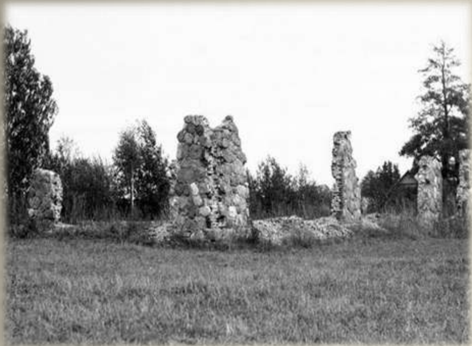
Ruiny posiadłości Piłsudskich W Żułowie okręg wileński