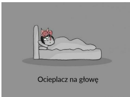
Ocieplacz na głowę