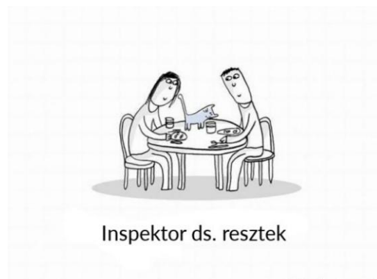
Inspektor ds. resztek