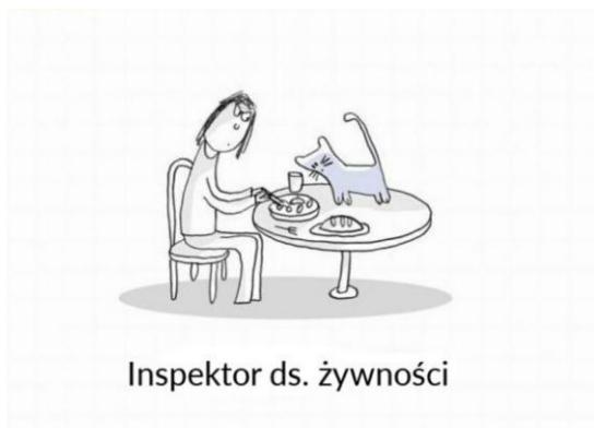
Inspektor ds. żywności

Sama książka uderza w podobne tony, co „Odyseja kota imieniem Homer”. Opowiada o porzuconym kocie, przyciśniętym przez bibliotekarkę. Z pozoru zwyczajny zwierzątko odmienia nie tylko życie kobiety, ale także przyczynia się do ocieplenia wizerunku instytucji, w której pracuje. Kolejna pozycja dla tych, którzy uwielbiają historie bezinteresownej przyjaźni między człowiekiem a zwierzęciem, poruszająca i dająca nadzieję na lepsze jutro, a przy tym akcentująca rolę, jaką odgrywają zwierzątka domowe w życiu ich właścicieli.