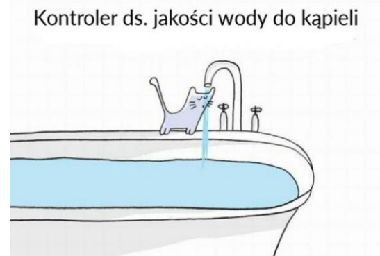
Kontroler ds. jakości wody do kąpielii