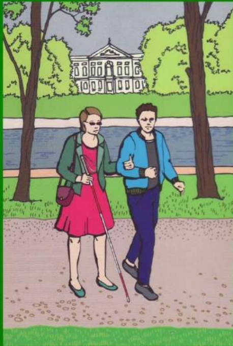
Savoir-vivre wobec osób z niepełnosprawnością

Kiedy osoba niewidząca prosi o zaprowadzenie w konkretne miejsce, podaj jej swoje ramię i idź pół kroku przed nią. Nie ciągnij jej za rękę, ani nie szarp. Gdy osoba niewidoma porusza się z psem przewodnikiem, idź po stronie przeciwnej niż pies. Jasno komunikuj o zbliżających się przeszkodach (schody, dziura, zakręt)